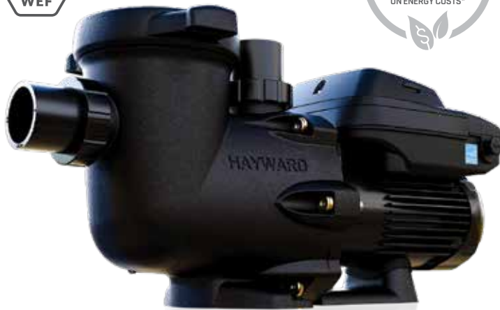
TRISTAR® VS 950